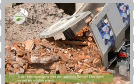
In der Betonherstellung wird der natürliche Rohstoff Kies damit so weit als möglich ersetzt.