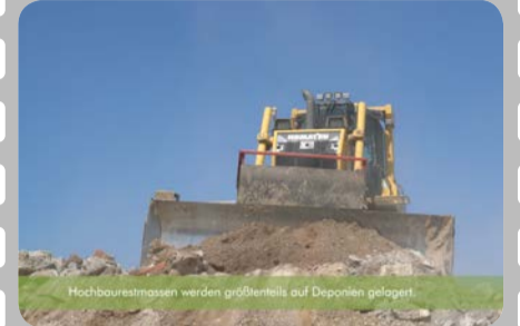
Hochbaurestmassen werden größtenteils auf Deponien gelagert.