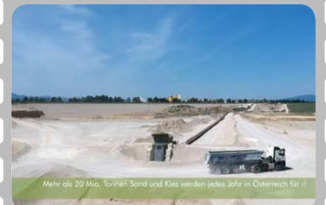
Mehr als 20 Mio. Tonnen Sand und Kies werden jedes Jahr in Österreich für...