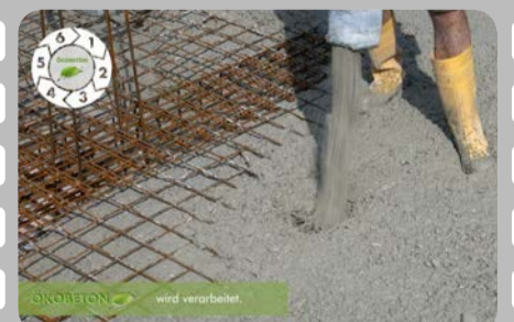
ÖKOBETON wird verarbeitet.

Hier geht's zum Video! (Einfach QR-Code scannen)