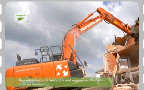
Baurestmassen sind Wertstoffe und werden mit Ökobeton in einen Kreislauf ge...